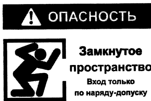
Рекомендуемый знак «ОЗП».

2. Объекты, вошедшие в Перечень 1 и не являющиеся территориально обособленными объектами, должны быть обозначены знаком «ОЗП» (рекомендуемый текст).